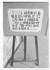
ある小学校校長室前に掲示してあった印象深い一枚

縁あって二回目の連合会長をさせて頂いたことになりました。市PTA連合会役員十七年目、今年が最後の年になります。本年の今治市PTA連合会からのメッセージは次の二つです。特に、日頃、PTAや子育てにあまり関心のない親御さんに向けて発信したいと考えています。